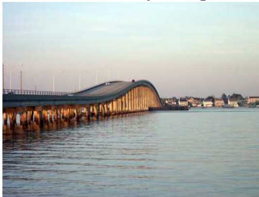
Atlantic Beach Bridge, NC

Pero hay otra verdad. Los cambios, en una comunidad y a un nivel individual suceden raramente de la noche a la mañana. Aun si el cambio parece repentino, generalmente hay cierto trabajo o proceso de pensamiento importante que han sucedido tras