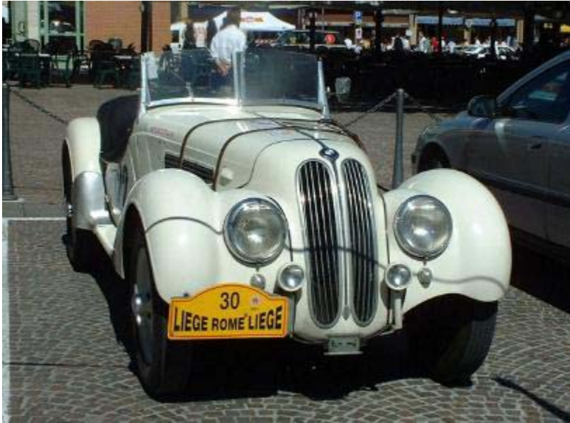
(BMW 328, 1936)

Der Krieg zerstört BMW. Im 1950er Jahren wurde BMW erfolgreich noch einmal. Im Jahre 1992 hat BMW mehr als Mercedes verkauft.